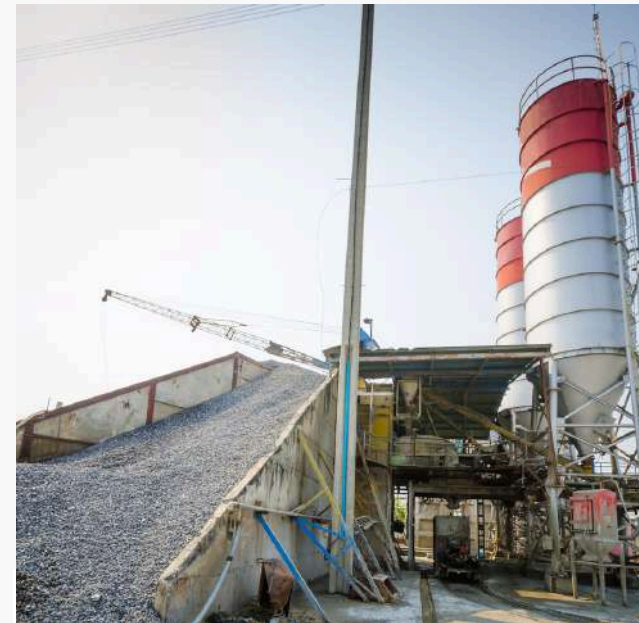
CEMENTERA CRUZ AZUL S.A DE C.V.