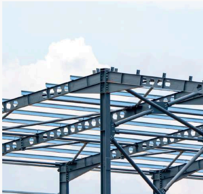
PLACERO S.A. de C.V.

Contamos el stock e infraestructura para atender la demanda de nuestros principales clientes como: