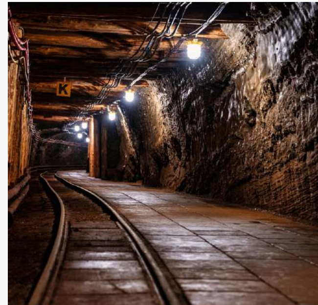
MUNMEX S.A de C.V.